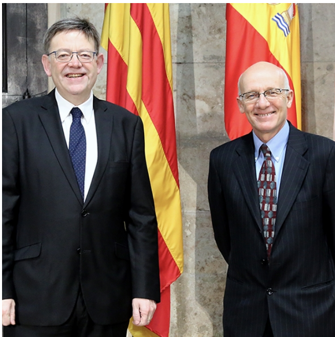
Susana Díaz en la 6ª edición de TRANSFIERE