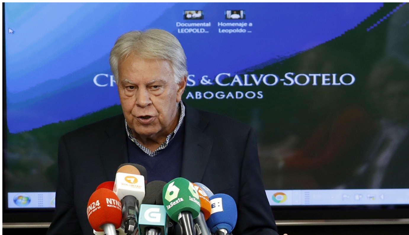
El expresidente del Gobierno Felipez González