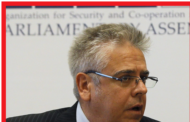
El diputado y portavoz en la comisión de Asuntos Exteriores, Ignacio Sánchez Amor

26 diputados y senadores socialistas pasarán a formar parte de las delegaciones españolas en las distintas asambleas parlamentarias internacionales. El diputado y portavoz en la comisión de Asuntos Exteriores, Ignacio Sánchez Amor, ha sido nombrado presidente de la Asamblea Parlamentaria de la Organización para la Seguridad y la Cooperación en Europa (OSCE), que agrupa a 57 países de Europa, Asia Central/Cáucaso y