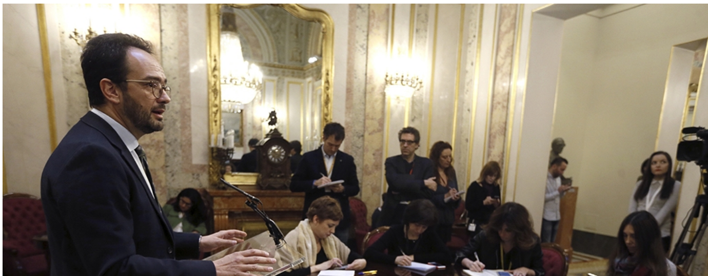
El portavoz parlamentario socialista, Antonio Hernando