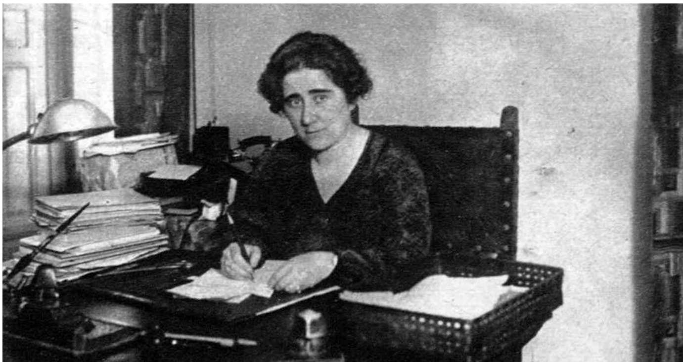
Clara Campoamor Rodríguez