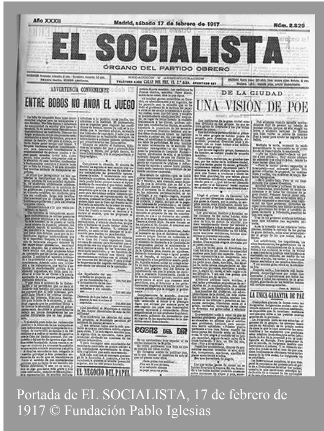
Portada de EL SOCIALISTA, 17 de febrero de 1917 © Fundación Pablo Iglesias

La falta de ocupación tiene unas consecuencias trágicas para los trabajadores y sus familias. Nos falta tiempo y carecemos de tranquilidad de espíritu para hacer literatura. Si de ambas cosas dispusiéramos describiríamos las realidades internas del hogar proletario, cuyos componentes están condenados a morir de hambre, porque el cabeza de familia, útil para el trabajo, no halla donde poder ocupar sus brazos. Y después haríamos algunas consideraciones, para determinar concretamente la responsabilidad de quienes pueden y deben poner remedio. ©Fundación Pablo Iglesias