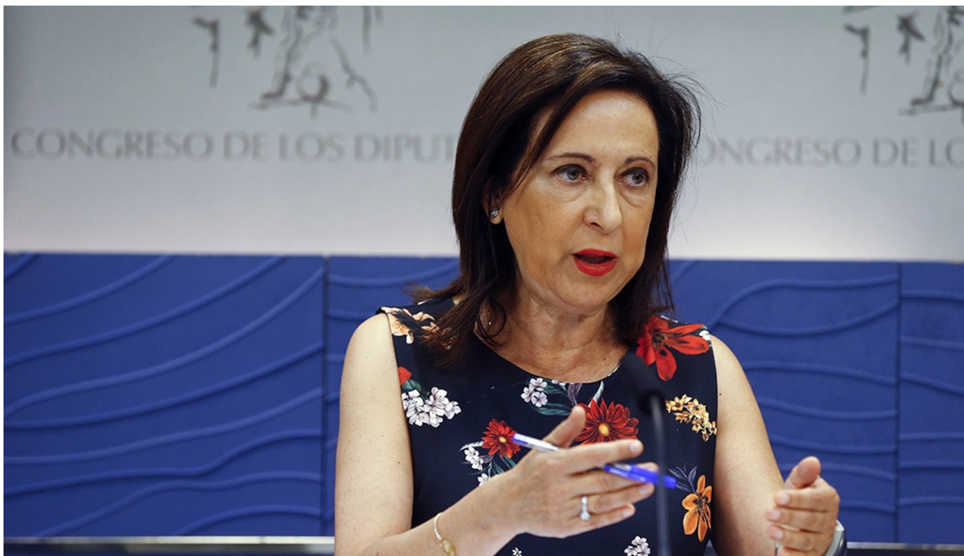
La diputada socialista Margarita Robles

La diputada socialista Margarita Robles se referió ayer a las cartas de la Fundación Francisco Franco que han dado a conocer los medios de comunicación y que estaban dirigidas a diversos alcaldes de municipios españoles, instándoles a la desobediencia y el incumplimiento de la ley de Memoria Histórica.